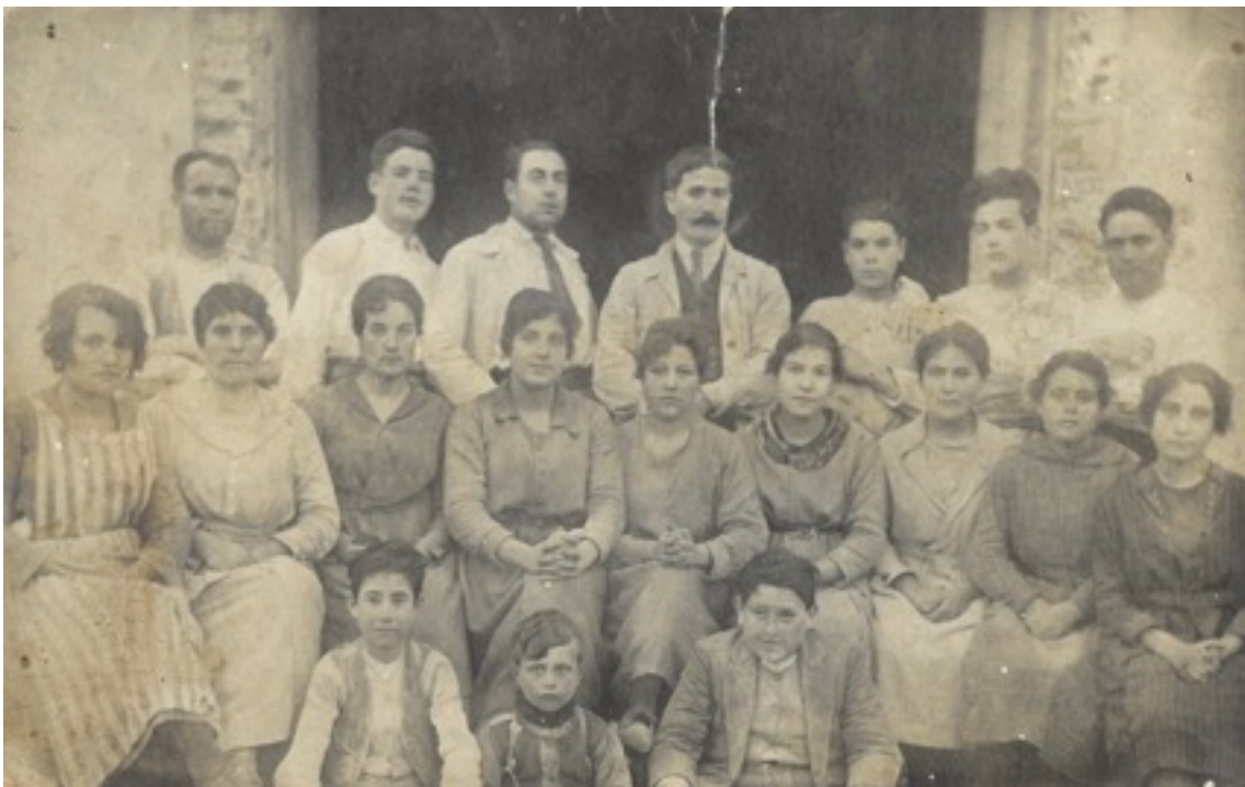
Ajuntament de Sarral

Una segona edat d'or per l'alabastre de Sarral i la seva indústria fou l'arribada del turisme a les costes catalanes. Aquest fet augmentà encara més la demanda d'alabastre en forma de làmpada, columna de suport o souvenir, provocant un augment molt gran del nombre de tallers i indústries dedicades a l'alabastre. Un total de 20 tallers i uns 500 treballadors foren el cel que ocupava Sarral durant les dècades dels 60, 70 i 80. Durant aquest període s'inicià el procés per treballar a Sarral però amb pedra d'alabastre procedent d'altres localitats.