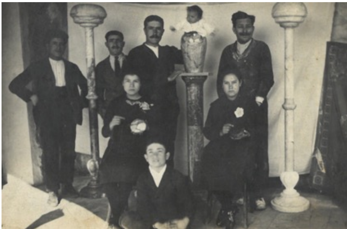
Ajuntament de Sarral

No és fins a la primera meitat del segle XVI, més concretament 1527, quan Damià Forment (València, c.1480 - Santo Domingo de la Calzada, 1540) va iniciar l'extracció d'alabastre de Sarral amb finalitats artístiques. En aquest material Forment realitzà el retaule major de l'església del Reial Monestir de Santa Maria de Poblet. A partir d'aquest moment, tot i la problemàtica que va