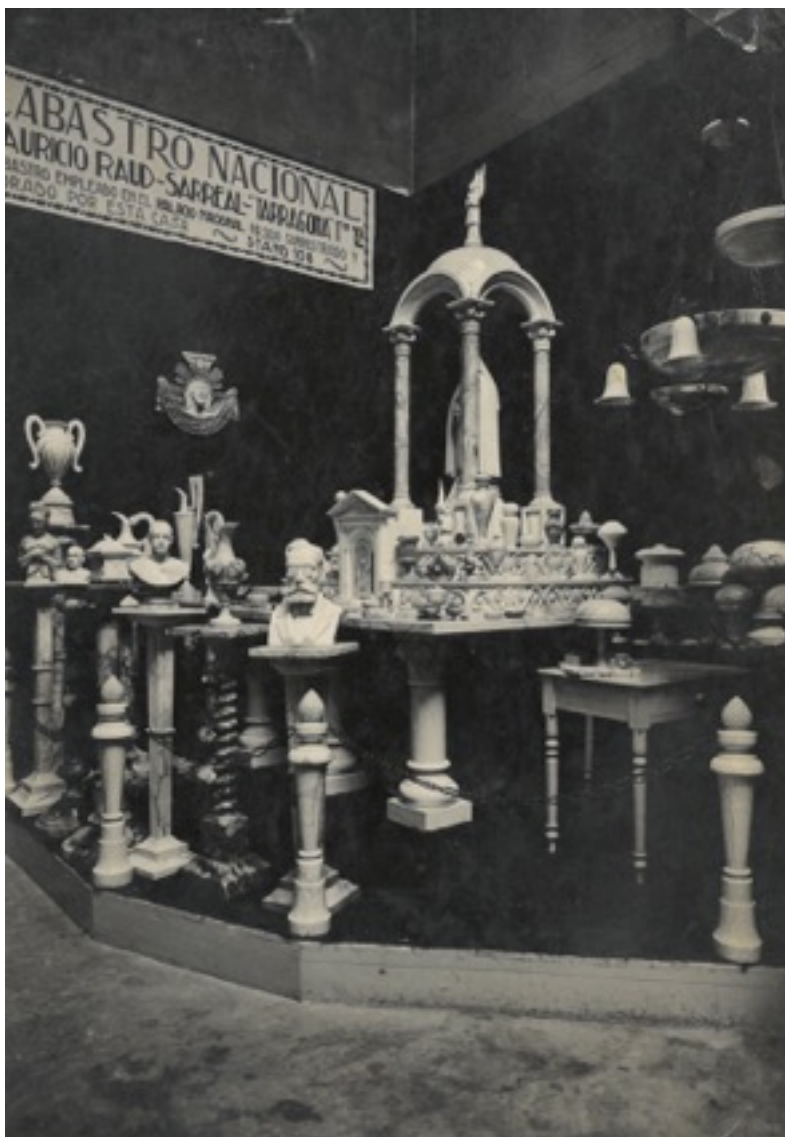
Ajuntament de Sarraï

La presència sarraïca a l'Exposició Internacional de Barcelona de 1929 i la presentació de nous dissenys, juntament amb una professionalització dels treballadors i l'arribada de nous escultors a Sarraï revifaren la flama de l'alabastre.